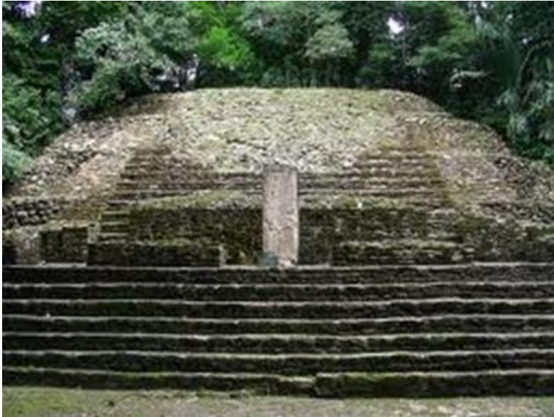
Lamanai: der kleine Tempel mit der Stella Nr. 9 welcher einer Person gewidmet war, die eine Verbindung zu einem Hochherrscher der Erdviertel hatte zwischen 650 n.Chr. Und .....